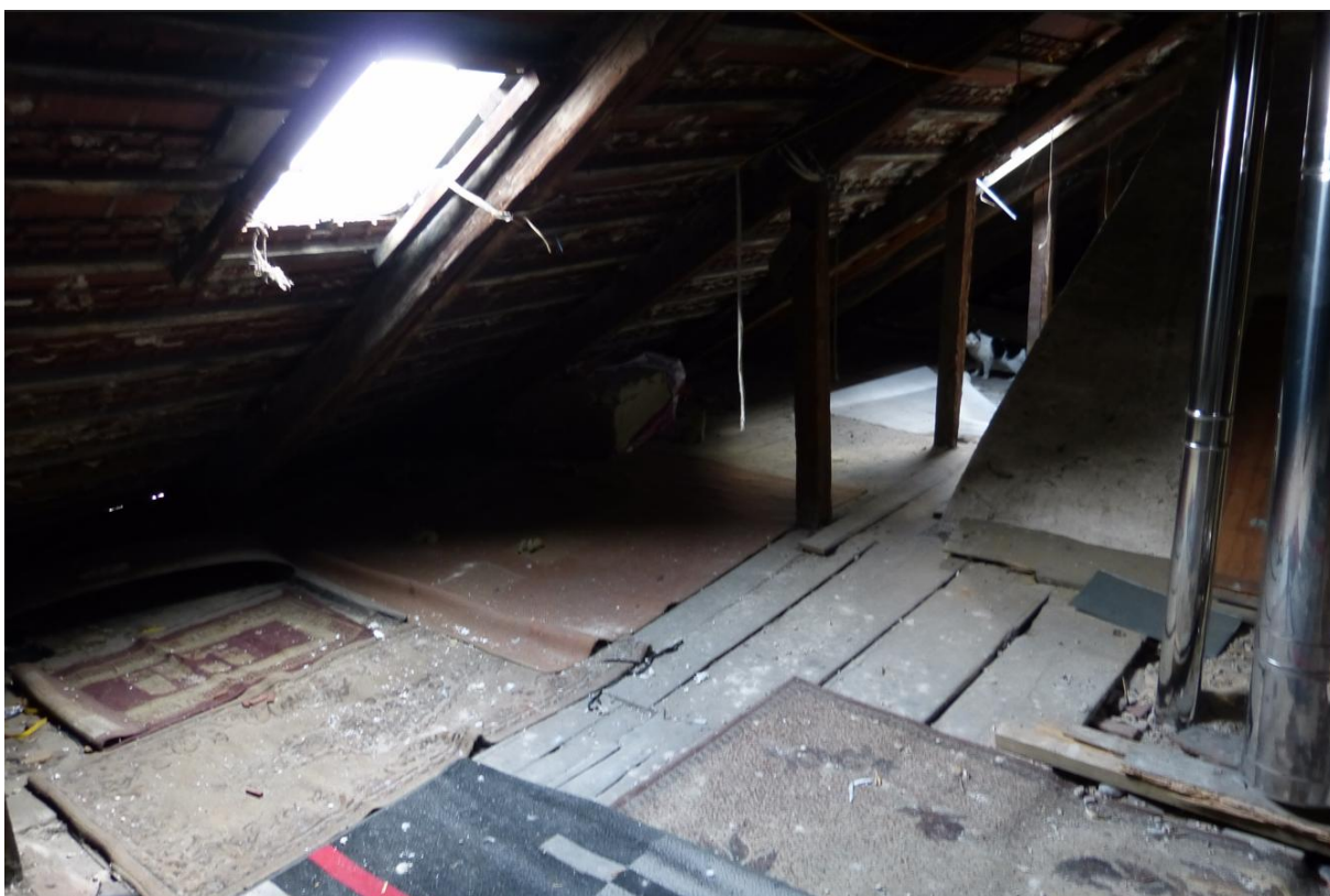
Fot. 4. Strych inwentaryzowanego budynku.