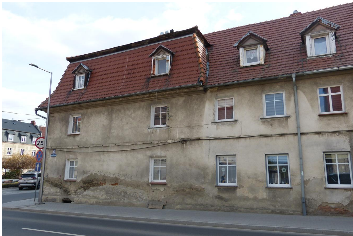
Fot. 1. Inwentaryzowany budynek.