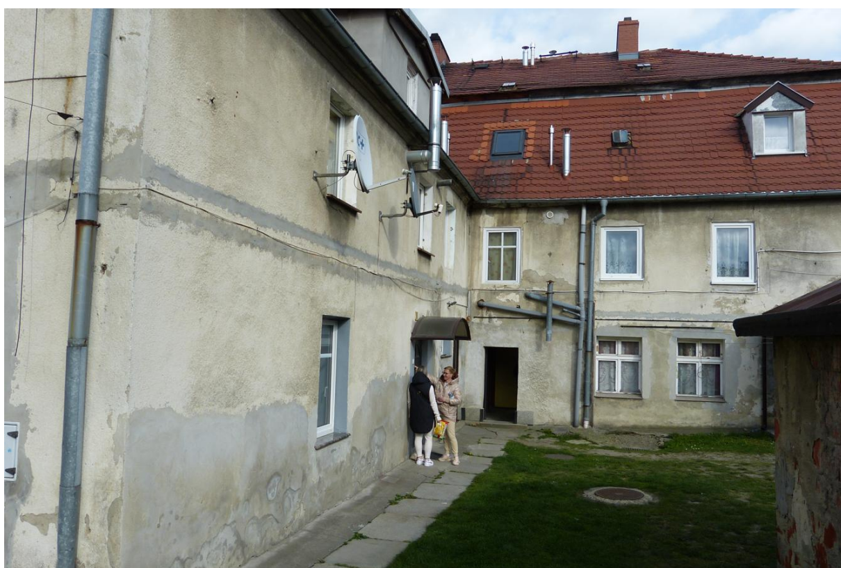
Fot. 2. Inwentaryzowany budynek.