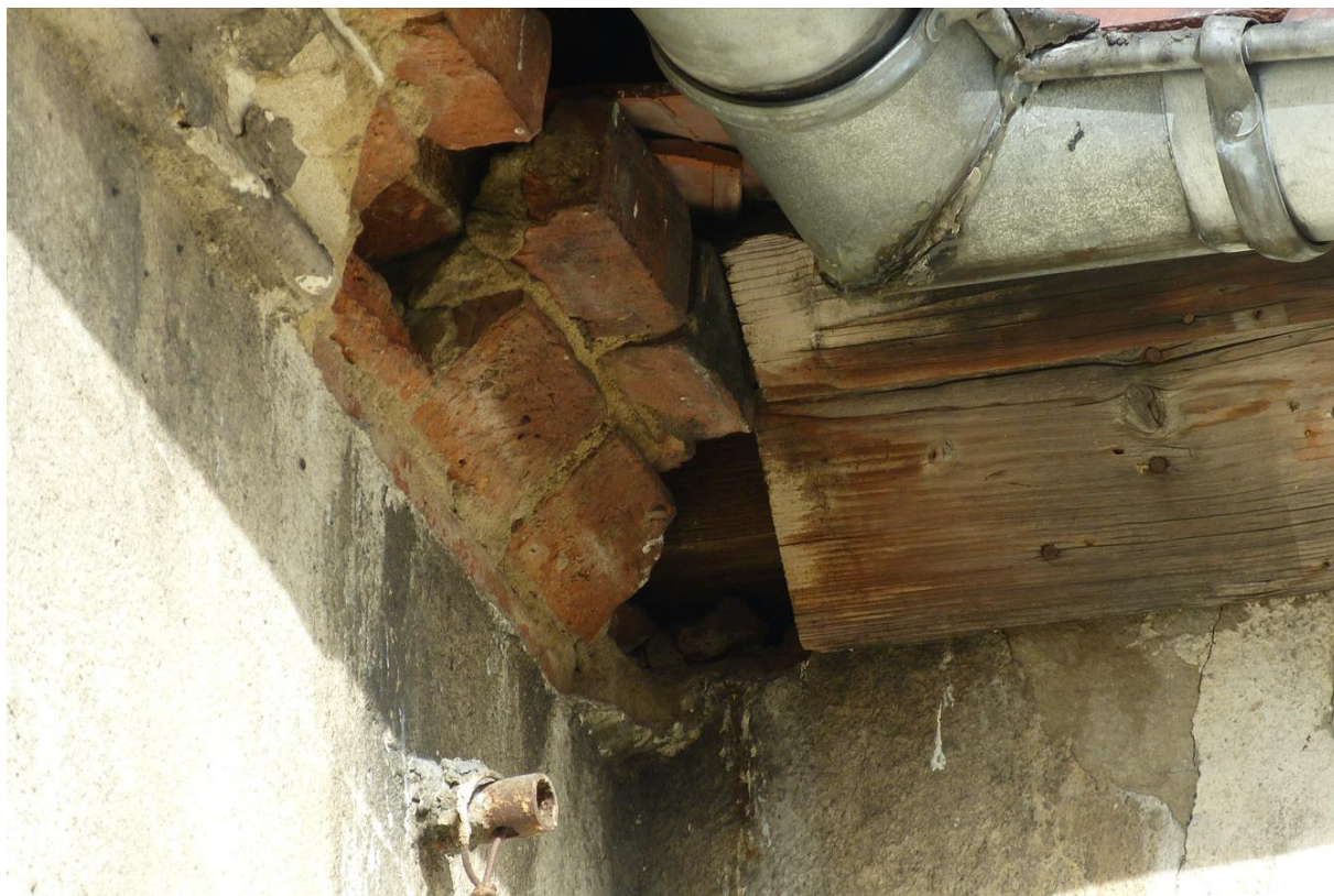
Fot. 6. Miejsce gniazdowania wróbli Passer domesticus .