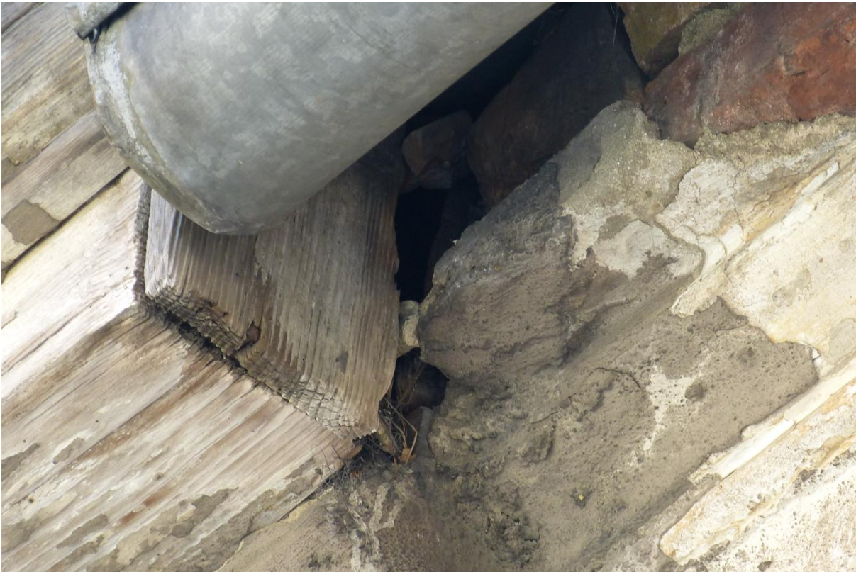
Fot. 5. Miejsce gniazdowania wróbli Passer domesticus .

W trakcie kompleksowej inwentaryzacji przeprowadzonej 10.04.2025 r., stwierdzono w obrębie inwentaryzowanego budynku siedliska rozrodcze ptaków oraz kryjówki nietoperzy. Znajdują się one w szczytowej partii elewacji, w podmurówce dachu przy belkach dachowych. Cała pozostała część elewacji pozbawiona jest nisz odpowiednich do rozrodu lub schronienia gatunków chronionych ponieważ nie posiada istotnych ubytków. Siedliska wykazane w trakcie przeprowadzonej inwentaryzacji zajęte są przez 2 pary wróbli Passer domesticus . Dodatkowo obecność otworów i szczelin w górnej części elewacji powoduje, że obiekt posiada również znaczenie dla nietoperzy m.in. karlika malutkiego Pipistrellus pipistrellus , karlika większego Pipistrellus nathusii , niektórych gatunków mroczków Eptesicus oraznocków Myotis .