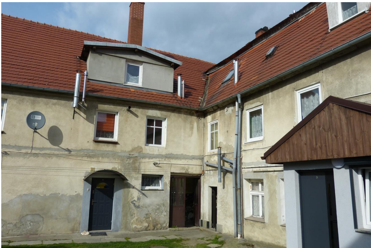
Fot. 3. Inwentaryzowany budynek.